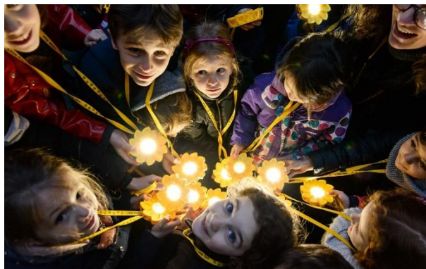
Lámpara Little sun, ejemplo de producto útil, sostenible y capaz de provocar placer gracias a su apariencia.

Su uso puede resultar muy placentero ya que implica, además, el ritual de cargarla al sol, con el trasfondo de sostenibilidad que ello representa. Funcionabilidad, usabilidad y apariencia son elementos que pueden estimular apego mediante el disfrute.