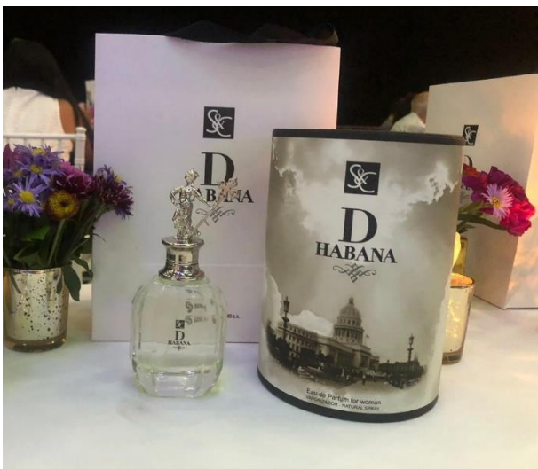
D Habana, perfume lanzado en ocasión del 500 aniversario de la ciudad de San Cristóbal de La Habana.

A juicio de los autores (corroborado en entrevista a consumidores del perfume) la motivación de la compra no fue precisamente la calidad del perfume, sino, que estuvo asociada a un grupo de factores como fueron: el hecho de ser un producto exclusivo e irreplicable pues su lanzamiento se hacía en sintonía con una celebración, la apariencia, la originalidad del envase, la asociación con elementos icónicos de la ciudad, como es La Giralilla, la información incluida y las historias creadas a partir de un aniversario tan destacado.